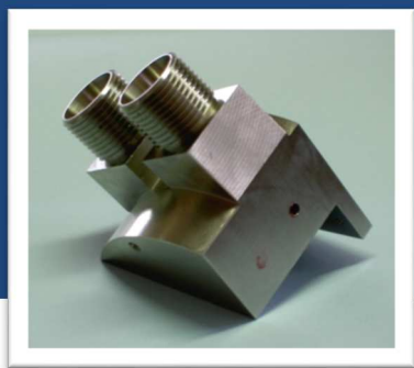
Mécanique de Précision